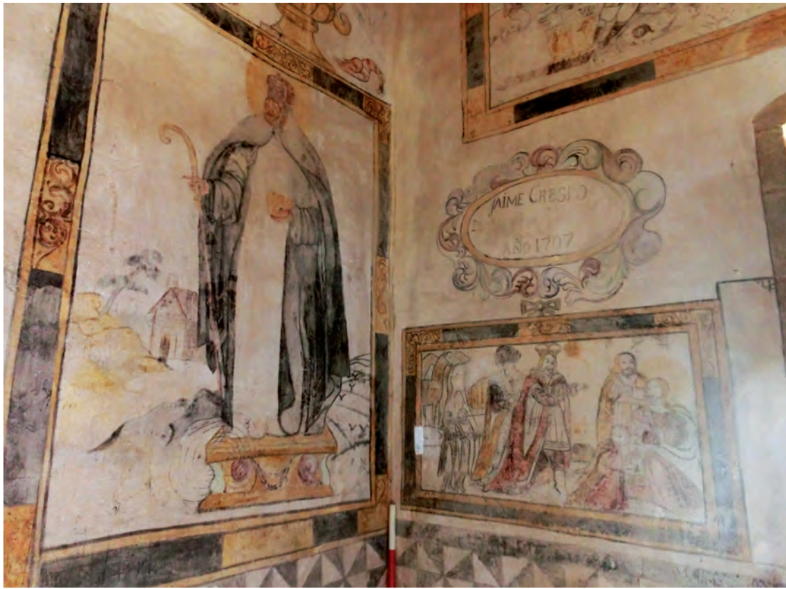
Fig. 2.- Llenç 1: S. Frutos. Llenç 7: l'Adoració dels Mags i el medalló de Jaume Crespo de 1707.

geomètric que forma una xarxa de quadrats dividits per triangles en blanc i negre disposats de manera que produeixen l'efecte d'unes aspes de molí tangents.