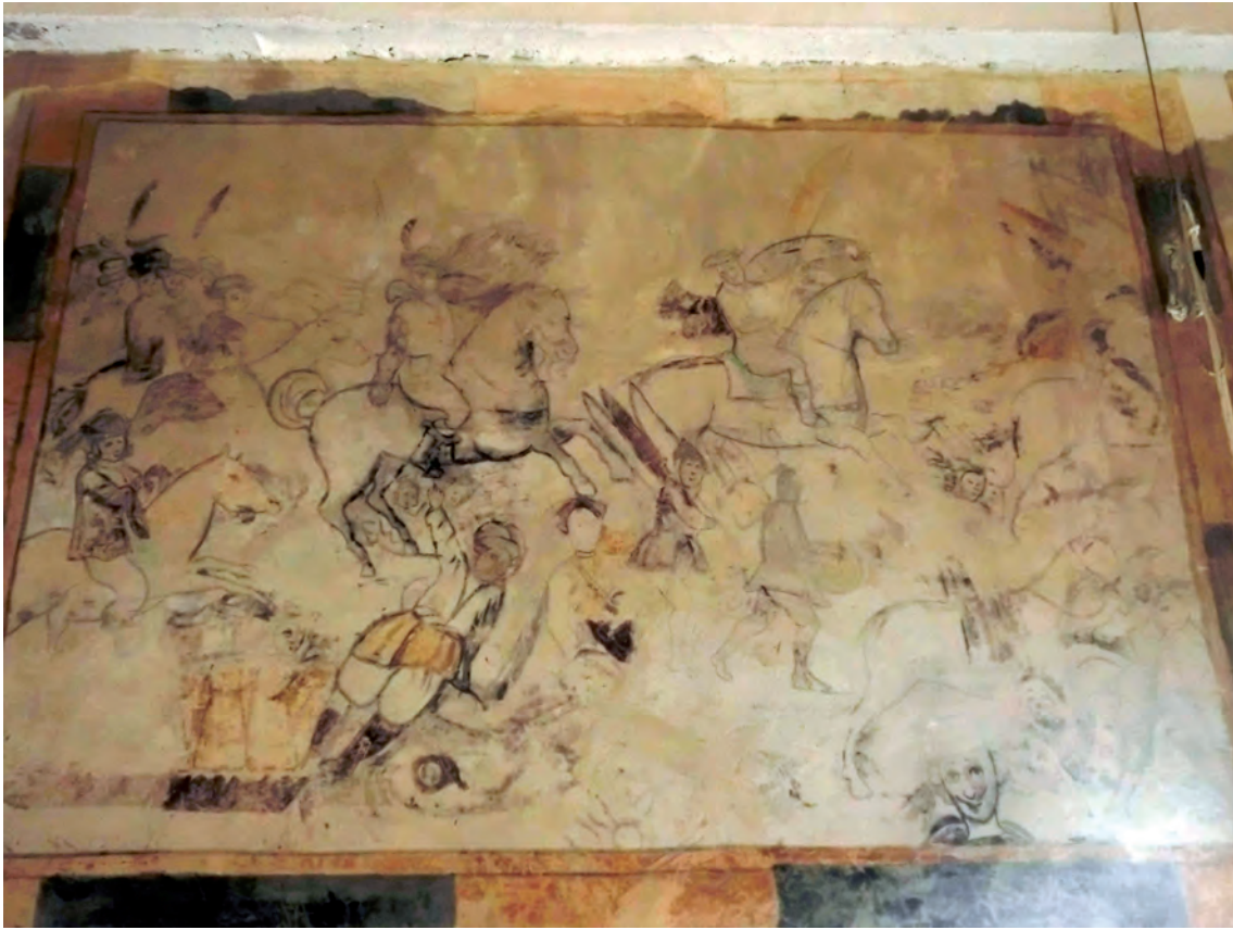
Fig. 6.- Llenç 7: quadre de S. Jordi i el drac.

En el cas de Benissa, en el breu lapse de temps de 13 anys, vam passar de tenir una sola església parroquial dedicada a S. Pere a sumar: el convent erigit amb honor de la Puríssima Concepció, l'aparició, casualment miraculosa de mans d'uns peregrins angelicals el 15 d'abril de 1624, del retaule de la Puríssima Xiqueta, i l'edificació de la primera ermita rural en Sta. Anna 16 .