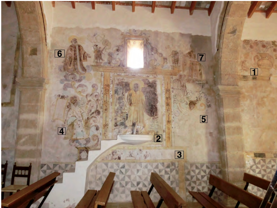
Fig. 4.- Llenç 2: el retaule pintat amb les figures de sants. Part del fris del llenç 1 amb els florers de bronze daurats i les aus.