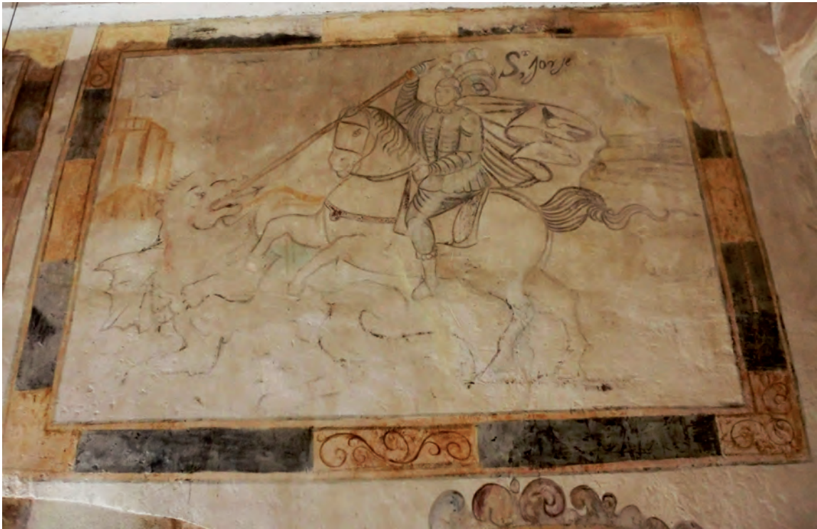
Fig. 5.- Llenç 7: cuadro amb l'escena de batalla.

mestres espirituals, pretenen suggerir d'aquesta manera que els fets meravellosos no són terrenals, sinó que es produeixen en l'esperit, en la pura interioritat dels subjectes mortals. Per això no intervenen els sentits, en particular la vista, ja que la manifestació divina es produeix estrictament d'una manera espiritual. El fet que siguin dues figures masculines els que veuen l'aparició, ens inclina a pensar que poden ser els sants de la Companyia de Jesús, ja que es habitual que, tant el fundador Ignasi, com l'apòstol de les Índies Francesc Xavier, foren representats conjuntament presenciant visions divines. A més, la vestimenta de calçons curts i bombatxos, del tipus conegut com a greguescos , i el gipó corporal, encaixen amb la roba característica del segle XVI, moment vital d'ambdós sants.