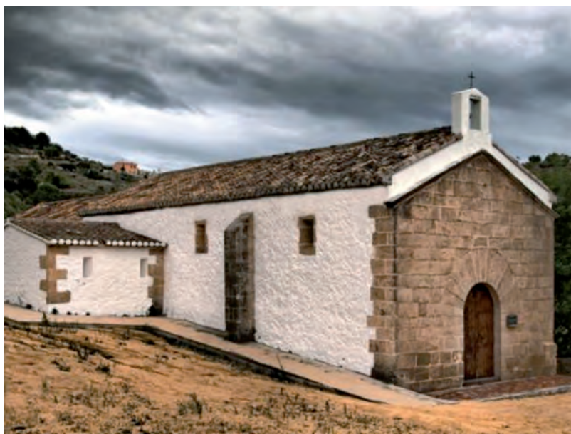
Fig. 1.- Aspecte exterior de l'ermita de S. Anna de Benissa.

A l'obra original se li va afegir en l'any 2002 mig metre més d'alçària per a recol·locar el sostre, i va ser aquesta intervenció la responsable de la desaparició de la part superior de les pintures murals. La restauració també va donar una dada important, l'aparició d'una finestra cegada en la part de la sagristia. En origen existirien sis finestres, una per crugia, tres i tres en cadascunes de les parets laterals, però sempre se n'havien vist cinc degut que la sagristia va haver-hi de fer-se amb posterioritat, i va encegar el finestró fins aleshores.